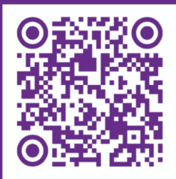
QR CODE À SCANNER